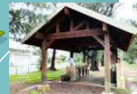
▲ 洗い場は4ヶ所 炭捨て場もあります。