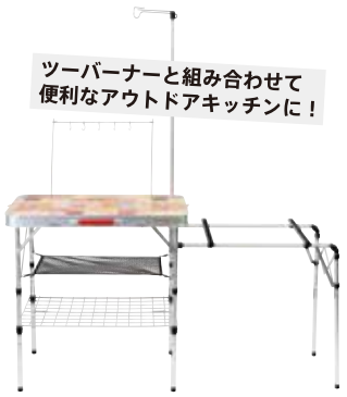
キッチンテーブル (約150cm×約60cm×約80cm) 1,650円