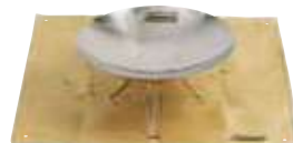
焚き火台 (シート付) 1,100円 薪は売店にて購入できます。