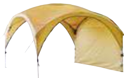
タープ/コールマン (約360cm×約360cm×約265cm) 2,200円