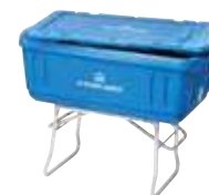
アイスボックス 2,200円