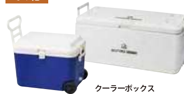
クーラーボックス (約55cm×約35cm×約40cm※30L) 小 550円 (約85cm×約40cm×約50cm※50L) 大 880円