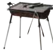
BBQ グリル (鉄板・トング・フライ返し付) (約65cm×約30cm) 1,320円