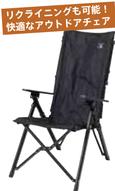
ハイバックチェア 880円