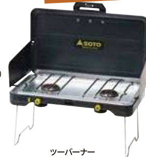
ツーバーナー (約50cm×約30cm) 1,650円 ガスは売店にて購入できます。