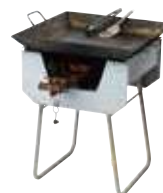
ガス釜セット (約50cm×約50cm) 3,300円