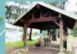
▲ 洗い場は4ヶ所 炭捨て場もあります。