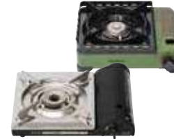
カセットコンロ 550円