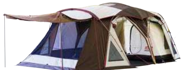
テント/コクーン 設置・撤去込み (約670cm×約400cm×約220cm) 11,000円