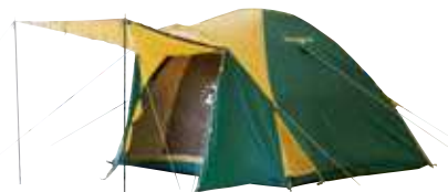
テント/コールマン (グランドシート付) (約270cm×約270cm×約170cm) 2,200円