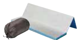
寝袋 660円 マット 330円