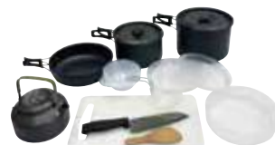
調理器具セット 4名用 1,100円 8名用 1,650円