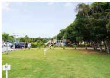
サイト番号: 35 ~ 40 番