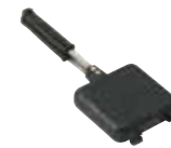
ホットサンドメーカー 550円