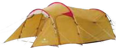
テント/スノーピーク (グランドシート付) (約530cm×約300cm×約150cm) 2,200円