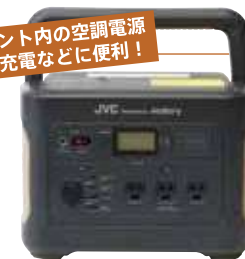
(1000Wまで) ポータブル電源 4,400円