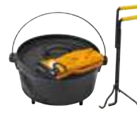
ダッチオープン 1,650円