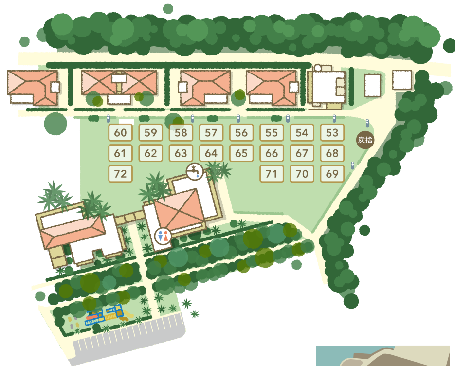
サイト番号: 53 ~ 72 番